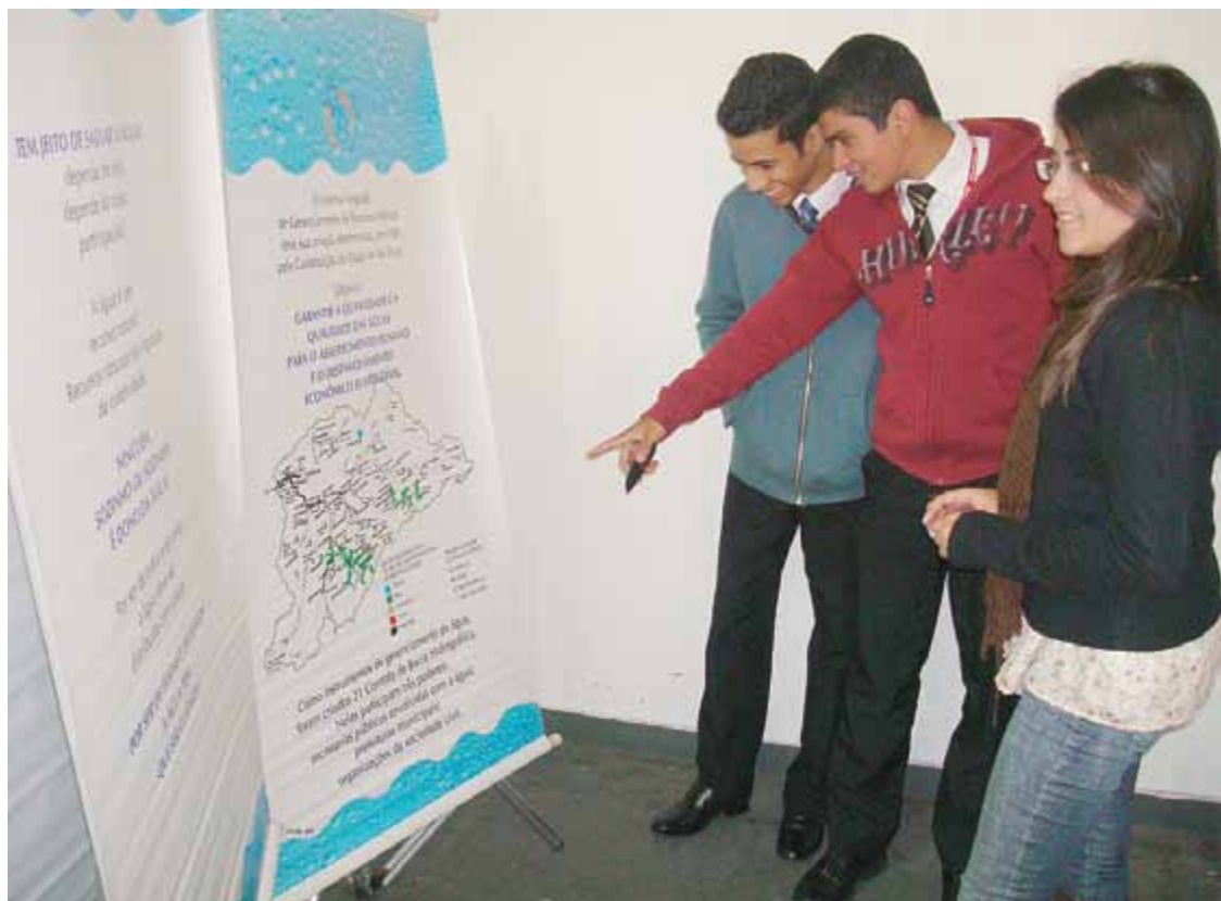
Dispostos em um ponto de passagem de funcionários e visitantes, exposição agradou aos olhos e passou informações importantes.

Por iniciativa do Gabinete do Meio Ambiente (GMA), de 30 de maio a 5 de junho de 2011 a SEICHO-NO-IE DO BRASIL promoveu uma exposição em comemoração à Semana do Meio Ambiente. Com o tema “A água na palavra da mulher”, 18 banners que foram cedidos pelo governo do Estado de São Paulo apresentaram a problemática da escassez de recursos hídricos e as atitudes para o uso racional da água, dentro da perspectiva poética da mulher.