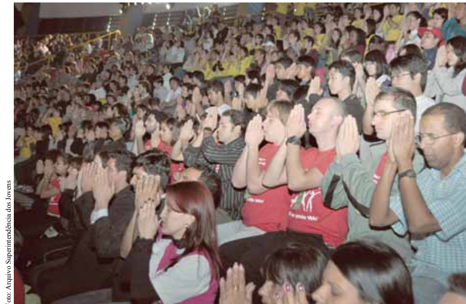
A festa também é da alma: os momentos de oração calam fundo no coração dos participantes.

Para praticá-la, todo o Movimento no Brasil começa a efetuar uma divulgação de grandes proporções das reuniões de Associação Local, instância a partir da qual se pretende constituir a maior parte do público da Convenção Nacional.