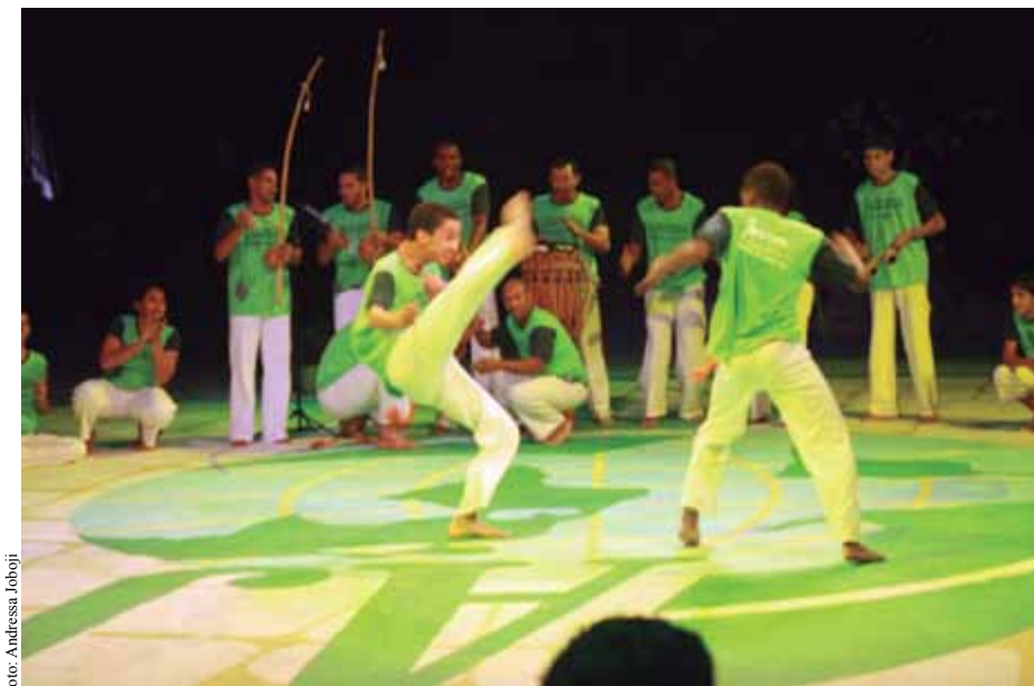
Shows artísticos vão deixar a plateia encantada.

O processo de despertar espiritual que dá substância ao que chamamos hoje de Convenção Nacional prossegue com a mais valorosa dentre as formas de caridade, conforme a Seicho-No-Ie: proporcionar ao próximo assimilar a Verdade e, assim, libertá-lo de todas as amarras e sofrimentos.