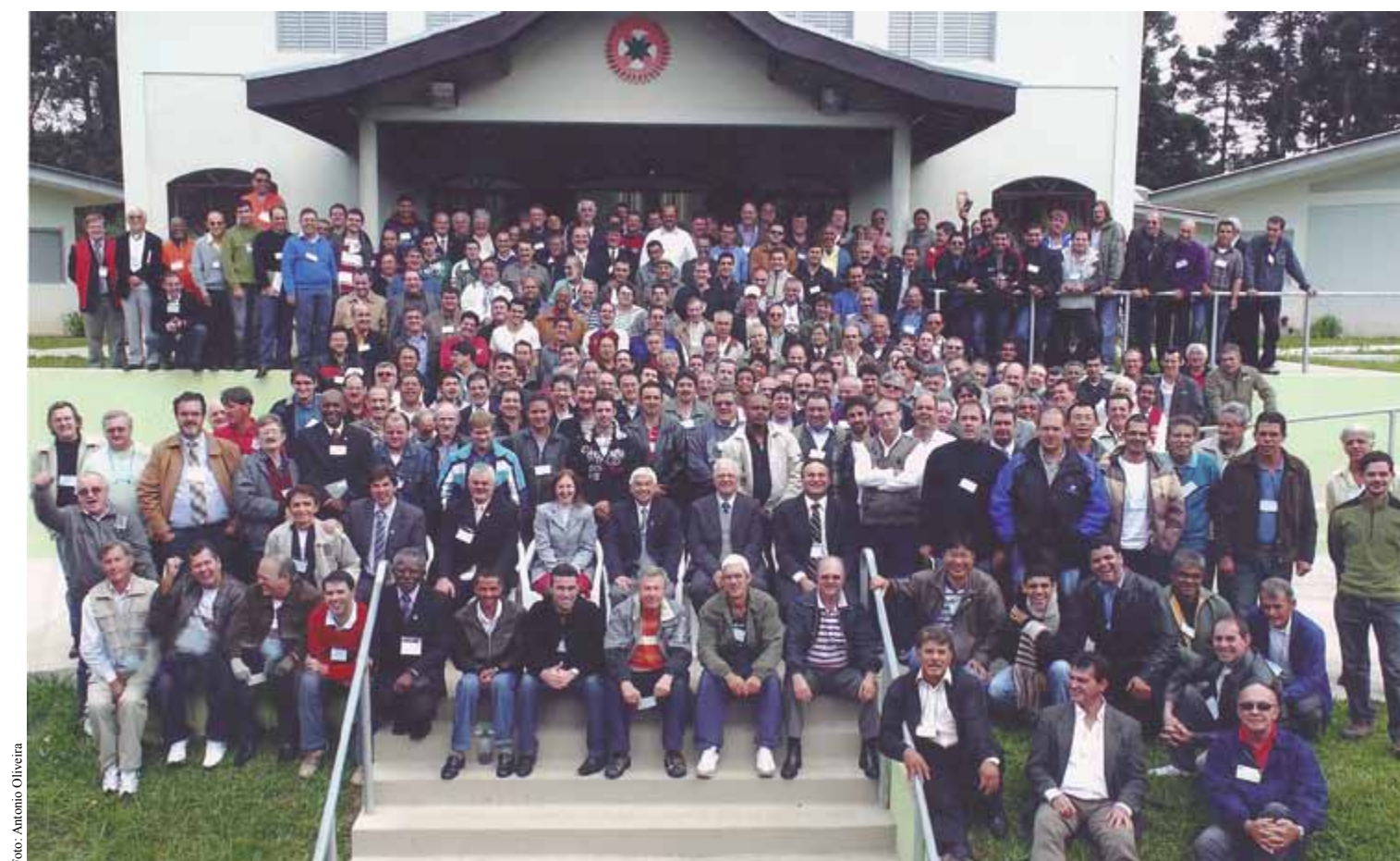
Em Curitiba, participantes celebraram evento que foi considerado histórico.

Com o tema “Despertar para uma nova vida”, eventos contaram com oficinas que abordaram assuntos pontuais como separação, revolta dos filhos, doenças nervosas e necessidade de buscar renda extra, todos desemaranhados à luz de refinada doutrina e de experientes orientadores.