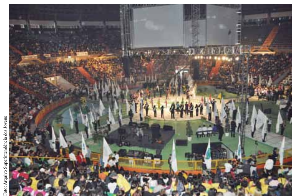
Quando a multidão se levanta para cantar as músicas e hinos, o espetáculo é protagonizado pelo público, que vive momentos de pura emoção.

Quem disse que a Convenção Nacional da AJSI vai acontecer somente no dia 24 de julho? A concepção em vigor em toda a SEICHO-NO-IE DO BRASIL define essa data como um marco comemorativo de um processo